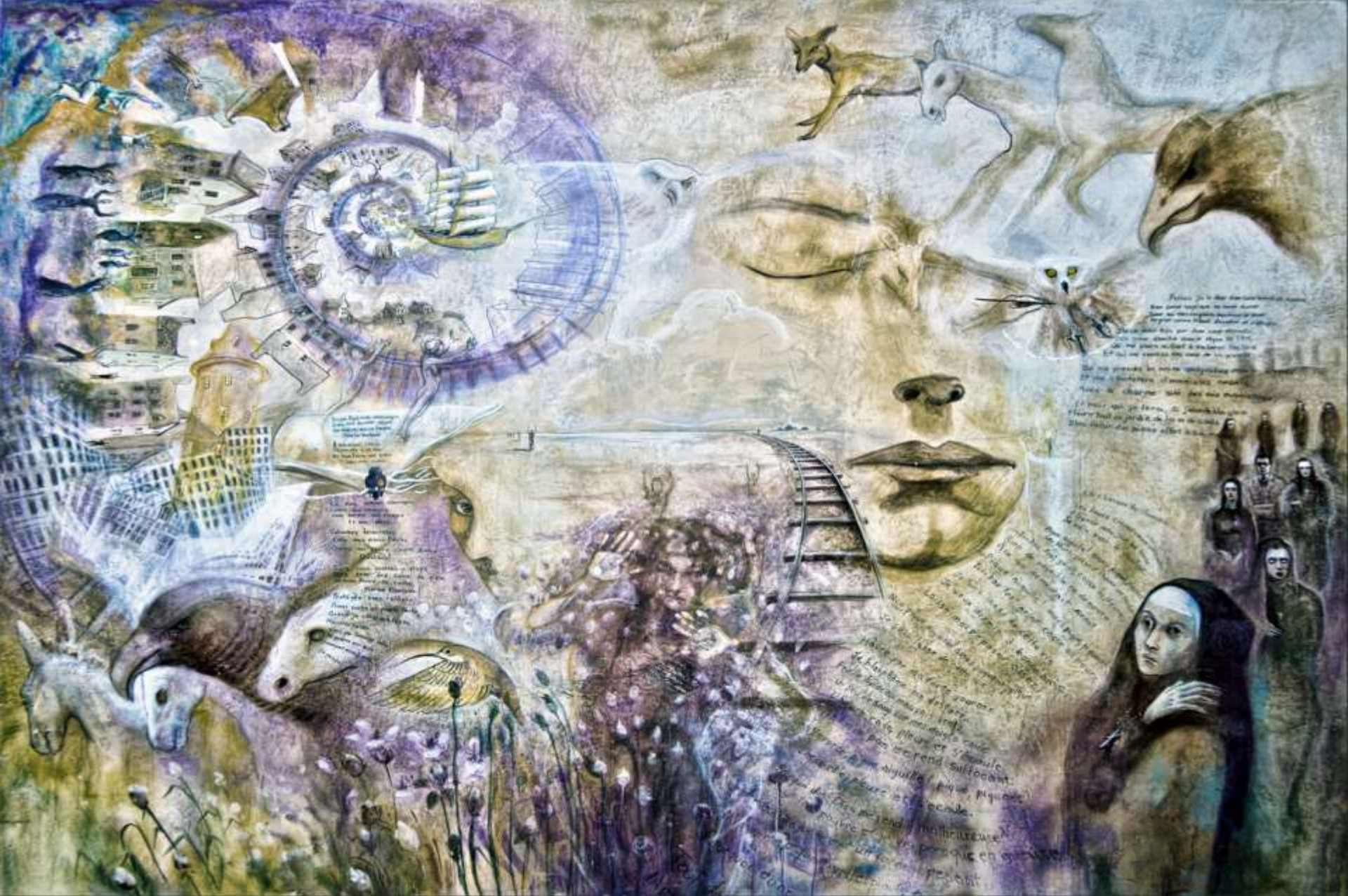
Œuvre de Mme Diane Lenoir